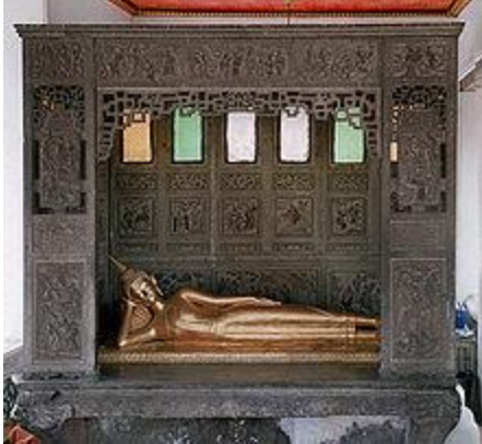
Gambar Buddha yang berbaring di Wat Suthat di Thailand melukiskan Buddha Gautama mencapai Parinibbana.

Buddha-Buddha yang telah ada sebelumnya bukan hanya berjumlah 28 Buddha. Sesungguhnya, Buddha Gautama telah menyampaikan jumlah Buddha yang tidak terhingga yang telah hidup beberapa kalpa lalu.